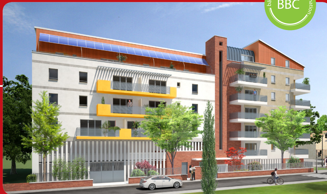
Illustrations non contractuelles à caractère d'ambiance dues à une libre interprétation de l'artiste et susceptibles de modifications pour des raisons techniques et administratives.