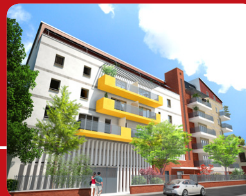
Résidence, vue côté rue