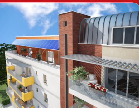
Résidence, vue côté terrasse

L'ALBION vous offre par ailleurs un cadre harmonieux dans une ville particulièrement dynamique et dont l'activité ne cesse de croître. Cette superbe résidence répond aux exigences des performances énergétiques BBC assurant d'un confort thermique et acoustique exceptionnel tout en maîtrisant les consommations énergétiques.