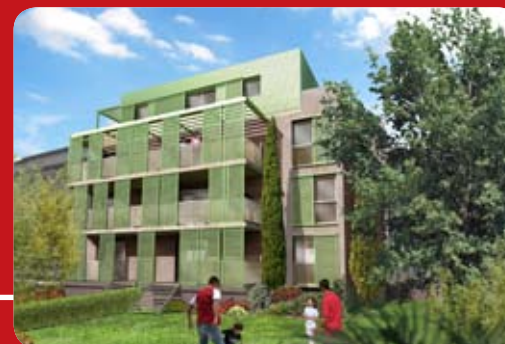
Résidence, vue côté jardin