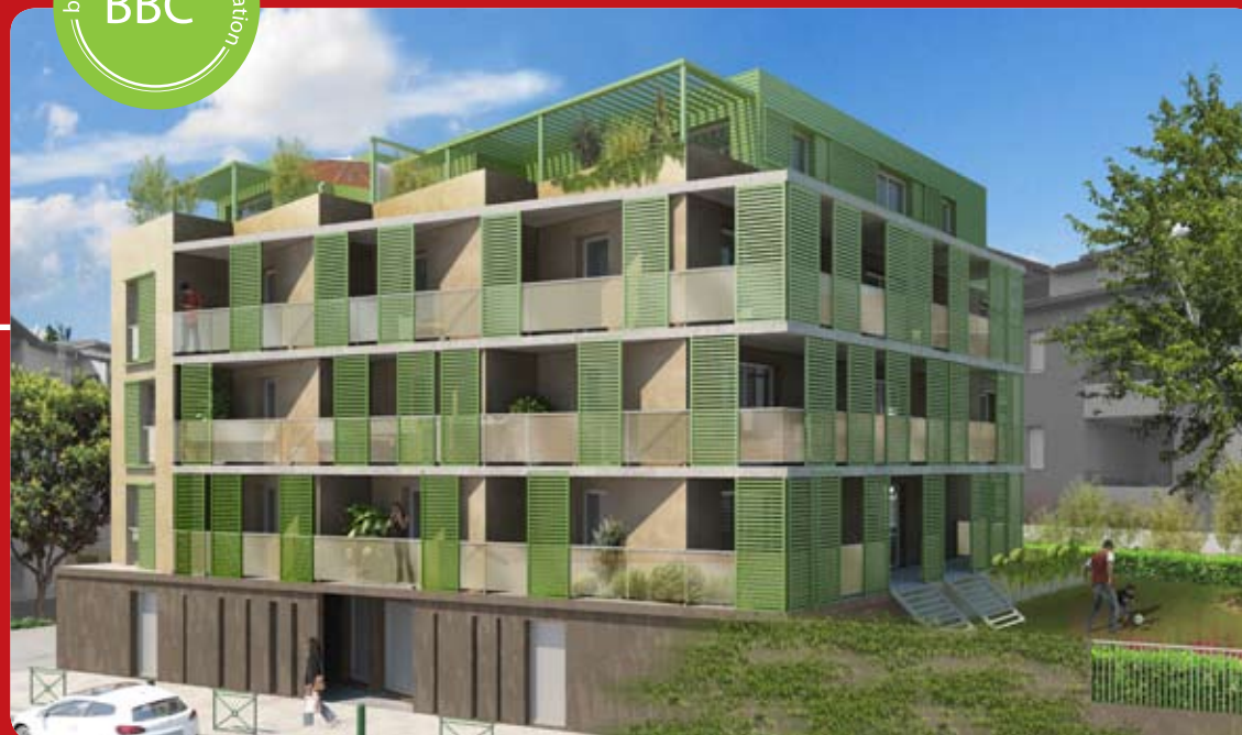
Illustrations non contractuelles à caractère d'ambiance dues à une libre interprétation de l'artiste et susceptibles de modifications pour des raisons techniques et administratives.